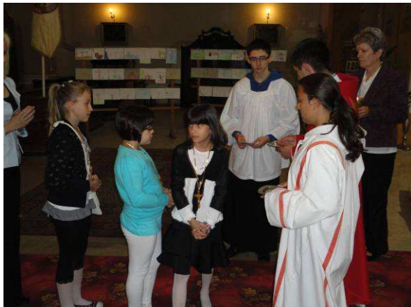
Úrnapi körmenet, 2012. június 10.